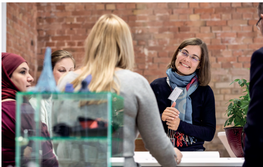
In den Workshops diskutierten die Teilnehmerinnen und Teilnehmer über konkrete Erfahrungen aus der Unternehmenspraxis.

In vier Workshops konnten die Teilnehmer des FORUM Personalmanagement ihr Wissen zu diesen Tools vertiefen und Erfahrungen aus der Unternehmenspraxis